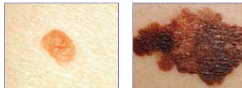
Figure 1. À gauche, un grain de beauté normal; à droite, un grain de beauté atypique, ou nævus dysplasique .

Les grains de beauté, ou nævi , sont courants : la plupart des gens en ont au moins quelques-uns. Un grain de beauté normal prend la forme d'une petite tache brune sur la peau (figure 1). Le risque de mélanome augmente avec le nombre de grains de beauté.